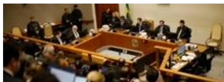
Une salle d'audience du tribunal supérieur de justice – ici, en 2019 lors de l'audience de réduction de la peine prononcée à l'encontre du président LULA da SILVA

M. SANSEVERINO a mis l'accent sur la quantité importante de procédures jugées par an par chacun des 33 magistrats du STJ, aux alentours de mille par mois.