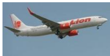
Un des BOEING 737 de la flotte de LION AIR

Le groupe LION AIR créé en 1999 par les frères KIRANA est un acteur majeur du secteur aéronautique low cost mondial, qui exploite plusieurs compagnies aériennes (dont LION AIR, WINGS AIR, MALINDO AIR, BATIK AIR et THAI LION AIR), essentiellement en Indonésie, dont il détient 50 % du marché, et en Asie à partir de l'Indonésie, et qui opère une flotte d'environ 280 aéronefs, à l'origine essentiellement des BOEING 737.