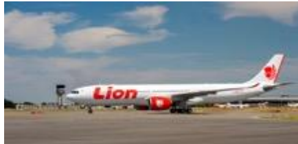
Nouvel AIRBUS A330 livré récemment à LION AIR

Le 14 novembre 2022, le tribunal a ainsi pu prononcer la clôture de l'ensemble des procédures, constatant la disparition des difficultés (article L. 622-12 du Code de commerce applicable à la sauvegarde) ou encore l'extinction du passif (article L. 631-16 du Code de commerce applicable au redressement judiciaire).