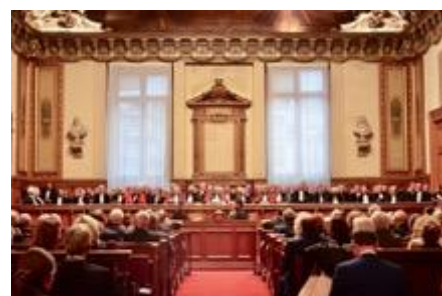
Audience solennelle d'installation du tribunal, dont les nouveaux juges le 17 janvier 2023