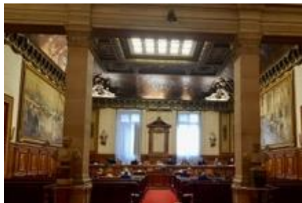
Telle une ruche la grande salle du tribunal transformée en salle d'examen pour répondre aux 56 questions de l'épreuve de QCM

Reste que la nouvelle promotion s'est montrée disponible et ouverte. Armée d'une réelle motivation, elle a répondu désormais à l'appel, pour rejoindre les chambres d'affectation. Nul doute qu'elle restera soudée et donc prête à l'entraide sans faux-semblant, gage d'un parcours parmi nous tout à la fois harmonieux et couronné de succès.