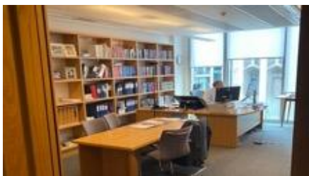
Un bureau d'un des 96 juges des Business and Property Courts of England and Wales

In October 2017 these business-related Courts were all brought together under the umbrella title of “ The Business and Property Courts of England and Wales ” and located in a new building developed jointly by the Ministry of Justice and the City of London, and called the Rolls Building , because it was built on a site adjoining where the “Rolls” were formerly kept. It contained (then) state-of-the-art technology. It provides 57 courtrooms and permanent accommodation for all London-based specialist judges. It was said to be the largest concentration of business courts in Europe (if not the cosmos). It is important to note that what was achieved was co-location (not merger or harmonisation).