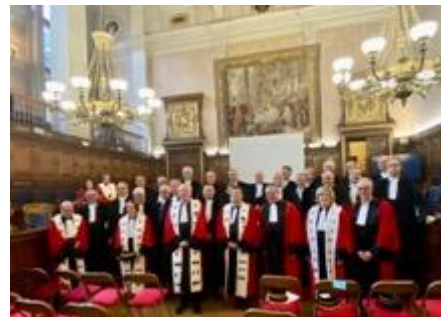
Après leur prestation de serment à la cour d'appel, les nouveaux juges réunis autour de Rémy HEITZ, procureur général, et Jacques BOULARD, premier président, de la cour d'appel de Paris, et Paul-Louis NETTER

Je requiers en conséquence qu'il soit donné lecture des procès-verbaux d'élection et de prestation de serment et qu'il soit procédé à l'installation des juges élus. Je requiers également qu'il me soit donné acte de mes réquisitions et qu'il en soit dressé procès-verbal.