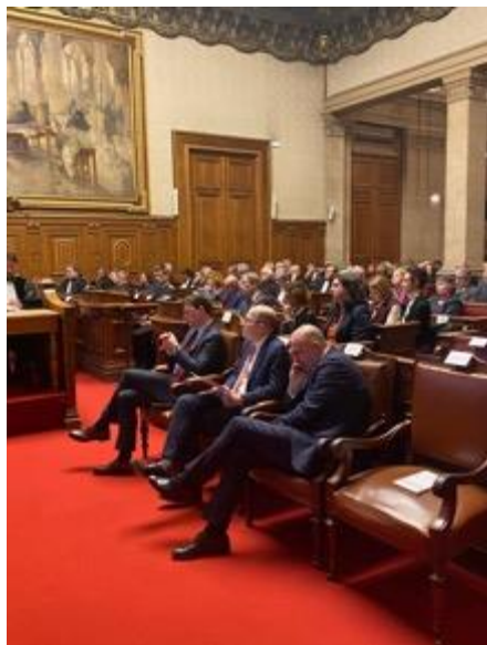
Vue de l'assistance avec au premier plan Stéphane NOËL, président du tribunal judiciaire de Paris

Peut-être une partie du solde pourra être affecté à un autre chantier majeur, à savoir l'attractivité de la Place de Paris.