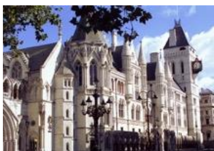
The High Court of Justice based at the Royal Courts of Justice on the Strand in the City of Westminster, London

Thus, business disputes were dealt with in either of those two broad divisions: the King's Bench Division and the Chancery Division , which form with the Family Division the High Court of Justice .