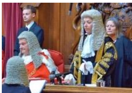
Dame Victoria SHARP, nouvelle présidente de la King's Bench Division prêtant serment devant le Lord Chief Justice, Lord BURNETT of MALDON

But the Court of Chancery (or the Chancery Division as it became) continued its separate existence: its judges were skilled in the application of equity, its procedures were adapted to addressing the issues it considered, and it had the focus, institutional structure and expertise to deal with matters which the common law had hitherto not addressed, such as trusts, the administration of estates, partnership, companies and bankruptcy.