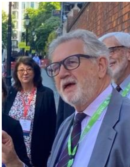
Hon. Sir Alastair NORRIS devant la Lincoln's Inn avec des collègues juges italiens et américains

“Following his visit in the summer of 2022 to the Business and Property Courts of England and Wales, your esteemed editor [NDLR: Dominique-Paul VALLEE] asked me to write an account of the English business courts.