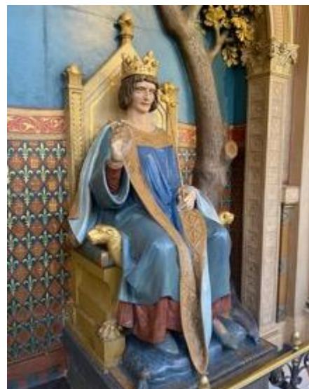
Le Roi de France Saint-Louis, auteur de l'Édit de 1243 concernant les courtiers – sa statue au sein des locaux de la Cour de cassation.

La première trace de réglementation connue des courtiers de marchandises en France se trouve dans les Statuts d'Avignon de 1243 qui leur interdisent de participer personnellement à une affaire.