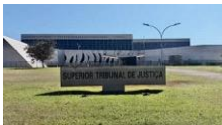
Le tribunal supérieur de justice (« Superior Tribunal de Justiça » ou STJ) à Brasília

Le STJ a une section de droit privé, divisée en deux chambres privées, ayant pour compétence l'ensemble des matières du droit privé, y compris le droit commercial et le droit des entreprises en difficulté.