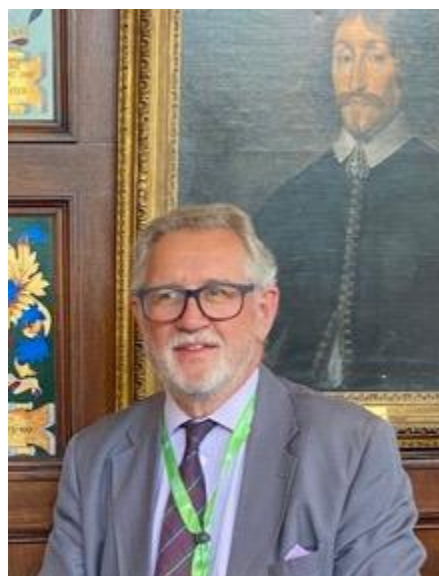
Hon. Sir Alastair NORRIS devant le portrait d'un de ses illustres prédécesseurs à la tête de la Lincoln's Inns, l'un des lieux historiques de la formation des « barristers » par leurs aînés

traitant des affaires économiques et commerciales.