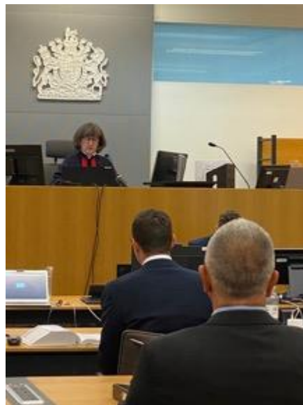
Une audience à 1 juge dans une des 57 salles d'audience du palais des Business and Property Courts of England and Wales

But the hope (which is being fulfilled) was that placing judges from the Commercial Court and the Chancery Division, the Admiralty Court and the Technology and Construction Court, the Probate Court and the Companies and Insolvency Court in the same building would lead to an exchange of ideas, harmonisation of similar procedures, the creation of Court Lists staffed by judges from different jurisdictions, and cross-jurisdictional experimentation.