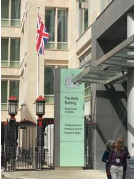
Entrée principale de l'équivalent à Londres du tribunal de commerce de Paris : The Business and Property Courts of England and Wales

So, business disputes might come before a wide range of Courts.