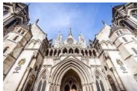
La Haute Cour de Justice de Londres

La reconnaissance des procédures ouvertes en France au bénéfice du groupe CIEL VOYAGE a donc été sollicitée sur le fondement du Cross-Border Insolvency Regulations (CBIR) de 2006 et, le 12 juillet 2021, des décisions de reconnaissance ont été prononcées par la Haute Cour de Justice de Londres.