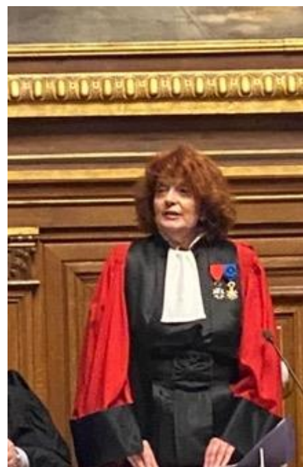
Laure BECCUAU, procureure de la République

Le temps de la suspicion n'est plus et la présence du parquet aux audiences des procédures collectives ne s'explique que par un constat : vos décisions ne sont pas seulement des jugements d'intérêt privé mais aussi des décisions avec un véritable impact d'ordre public.